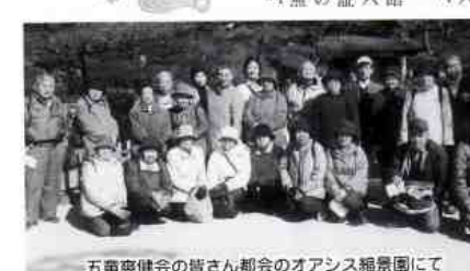
五竜爽健会の皆さん都会のアアシ稲園にて

1 下痢・便秘、それらが交代で起こる。 2 残便感がある(排便のあと、まだ残っているようで、すっきりしない)。 3 少量の粘液や泥状の便または、それらに血液が混じったものが何度も出て、トイレに頻繁にかよう。 4 原因不明の貧血。 5 おなかにしこりがある。 6 おなかが張る。 7 なんとなく下腹が痛む。