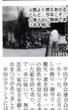
平田子供会連合会は、一月十一日、お正月のしめ飾り・御守り・破魔矢・書き初め・一年の抱負や希望などを書いた紙を持ち寄り、皆で一斉に焼いて、無病息災・家内安全を願うおまつりがありました。平田小グラウンドには、