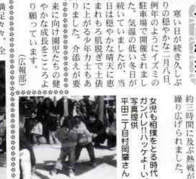
寒い日が続き久しぶりの相撲が二月八日、例年のようにイズミの駐車場で開催されました。気温の低い冬ですが、当日は穏やかな晴天に恵まれました。介添えが要りませんでした。