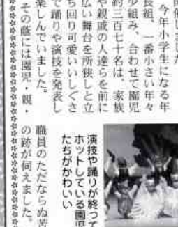
岩国南幼稚園は二月七日、岩国市民会館大ホールで、保育発表会を開催しました。