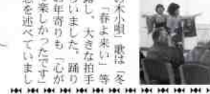
まつの木小唄、歌は「冬景色」「春来い」等を披露し、大きな拍手をもらいました。踊り子もお年寄りも「心が晴れて楽しかったです」と感想を述べています。

お年寄りの利用している平成デイサービスセンター平田を三十一日午後、梅ヶ丘民謡教室のひとたちが慰問し あつたのか多くの人で、会場では、お年寄りたち三十五人は踊り子たちの出演を待ちわびていました。 踊り子六人は、「おめでた音頭」「ふるさと音頭」「ふれあい音頭」