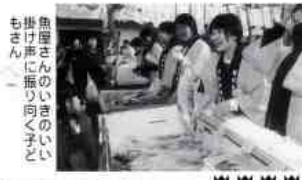
魚屋さんのいきいきと掛け声に振り向く子どもさん

第十四回 大盛況のフラガ岩商 恒例行事の「フラガ岩商」が昨年十二月十三・十四日、岩国商業高校(平田五丁目)で開催されました。 生徒が手づくりの商店経営をし、商業・ビジネスの専門知識や技術教育活動の成果を大盛況を収めるもの。 和・洋菓子、野菜、果物、海産物、花箱、乳製品、精肉、輸入雑貨、スポーツ用品、うどん、カレー、パン、ケーキ、やきいも、岩国物産展、バザー、吹奏楽部演奏、もちまき、子どもランド等のお店やイベントが沢山ありました。 取材の途中で本当の店員さんと間違える程