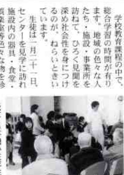
学校教育課程の中で、総合学習の時間が有ります。地域の色々な人たちが、施設・事業所を訪ねて、ひろく見聞を深め社会性を身に付けているのが、ねらいとされています。