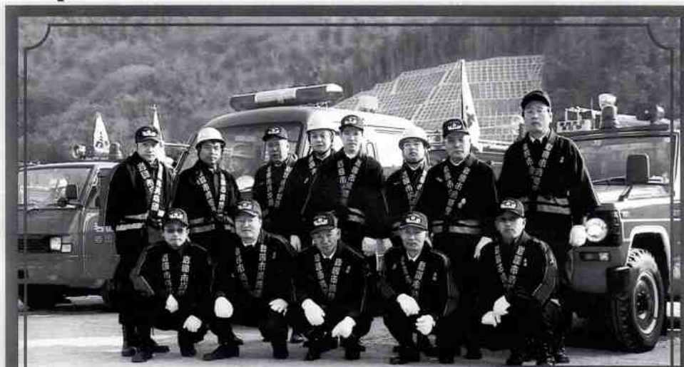
岩国分団第六部(平田) 平成16年1月10日

岩国市の消防出初め式が一月十日、錦帯橋そばの河川敷でありました。平田地区の岩国市消防団岩国分団六部もさっそうと参加し、団員としての適切な技・精神・責務の重要さの自覚をあらたにしました。式典後団員は河原に場所を移し、号令で一斉放水、見事なアーチを披露し、観光客や見物客は大きな拍手をしていました。昨今、コンビニート火災・放火・殺人といった不安な要素が多く有ります。自分で防げるものは自分で行いましょう。